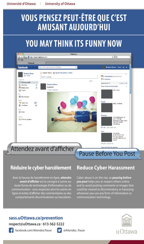
Figure 1: Affiches pour la campagne de sensibilisation sur la violence au sein de l'Université d'Ottawa