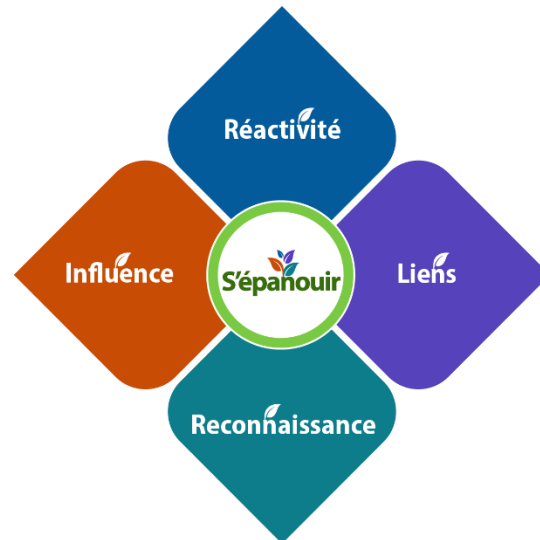
Figure 6 : Valeurs du point de vue de l'Université

En tant que membres de la communauté universitaire, nous jouons un rôle essentiel dans la structuration et le soutien de l'environnement d'apprentissage par notre leadership en matière de politiques, de programmes et de développement de relations à l'Université et ailleurs. Nous nous épanouissons en tant qu'organisation quand nous servons la communauté universitaire à titre de membres de celle-ci, ainsi qu'à titre de spécialistes, d'artisans et artisans du changement, et de citoyennes et citoyens réfléchis, qui appuient l'enseignement et l'apprentissage de manière efficace favorisant la création de liens, la réactivité et la reconnaissance.