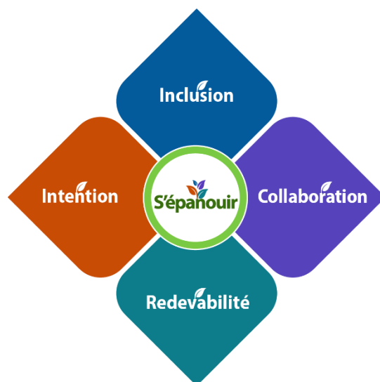
Figure 4 : Valeurs du point de vue de la personne qui enseigne

En tant qu'enseignantes et enseignants, nous avons le devoir de façonner l'environnement d'apprentissage. Nous nous épanouissons quand nous communiquons notre expérience et notre expertise à titre de spécialistes, de membres de la communauté, d'artisanes et artisans du changement et de citoyennes et citoyens réfléchis qui agissent avec intention, dans une perspective d'inclusion, de collaboration et de redevabilité.