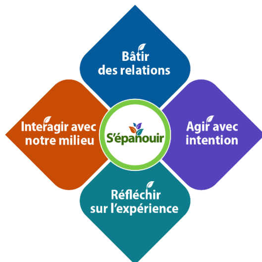
Figure 2 : Architecture du Cadre

Le Cadre s'articule autour de cinq principes fondamentaux.