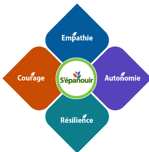
Figure 5 : Valeurs du point de vue de la personne qui apprend

En tant qu'apprenantes et apprenants, nous sommes des partenaires égaux dans l'expérience d'apprentissage, dont nous sommes aussi coresponsables. Nous nous épanouissons quand nous progressons à titre de spécialistes, de membres de la communauté, d'artisans et artisans du changement et de citoyennes et citoyens réfléchis qui s'impliquent dans l'enseignement et l'apprentissage avec courage, empathie, autonomie et résilience.