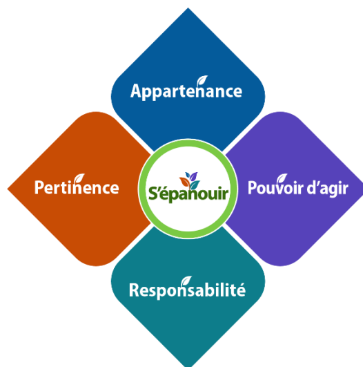
Figure 3 : Valeurs au sein de l'environnement d'apprentissage

Pour créer des environnements d'apprentissage qui favorisent l'épanouissement, il nous faut vivre en tant que communauté d'enseignement et d'apprentissage, et fonder cette dernière sur la pertinence, l'appartenance, le pouvoir d'agir et la responsabilité.