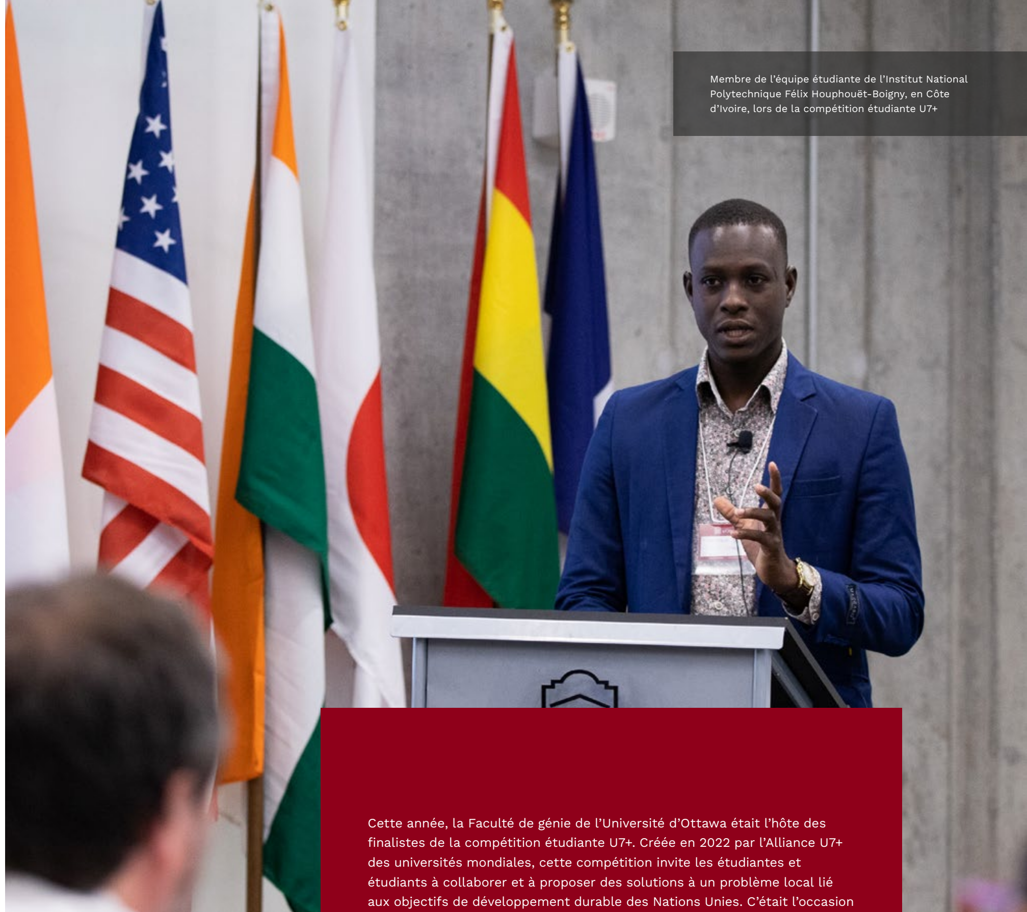
Membre de l'équipe étudiante de l'Institut National Polytechnique Félix Houphouët-Boigny, en Côte d'Ivoire, lors de la compétition étudiante U7+

En mettant sur pied un programme parascolaire qui favorise la santé mentale des jeunes à Ottawa dans un espace sûr et stimulant, les six membres d'une équipe étudiante ont allié leur passion pour les soins de santé et la musique. Ce projet, qui mise sur la musique pour resserrer les liens sociaux et améliorer les communications, appelait les personnes participantes à contribuer à des initiatives tangibles. Le projet émanait de CitéStudio, fruit d'une collaboration entre la Ville d'Ottawa, l'Université d'Ottawa et des partenaires communautaires.