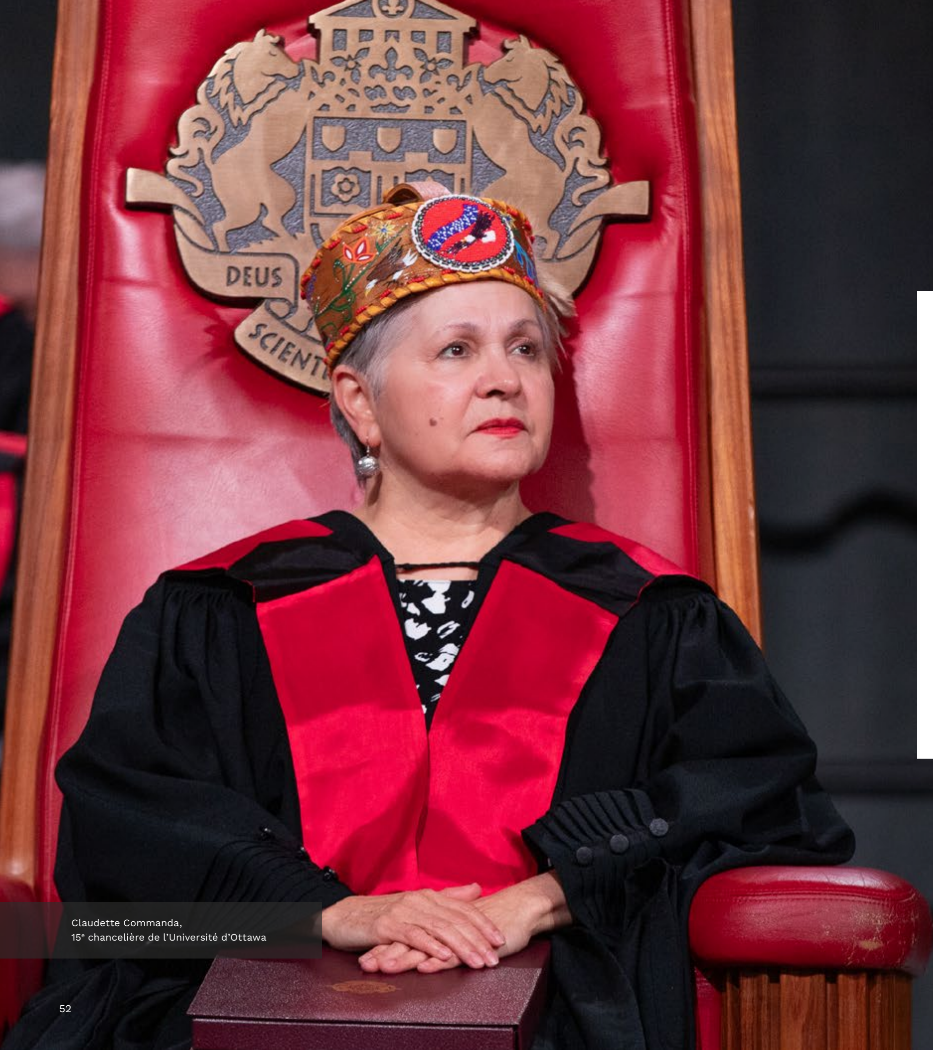
Claudette Commanda, 15 e chancelière de l'Université d'Ottawa

Une transformation ne se limite pas à apporter un changement. Il faut également semer pour cultiver de nouveaux changements dans l'avenir.