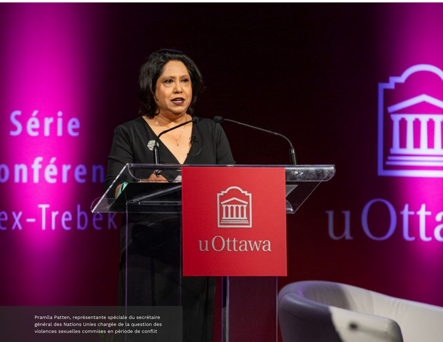
Pramila Patten, représentante spéciale du secrétaire général des Nations Unies chargée de la question des violences sexuelles commises en période de conflit

L'Université a signé au printemps 2023 un cadre de coopération avec Pramila Patten, représentante spéciale du secrétaire général des Nations Unies chargée de la question des violences sexuelles commises en période de conflit. Ce cadre appuie la recherche transformatrice de solutions en réponse à ce grave fléau. Il s'agit de la première entente conclue entre l'Université d'Ottawa et les Nations Unies.