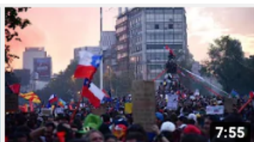
Le Chili : Un laboratoire constitutionnel