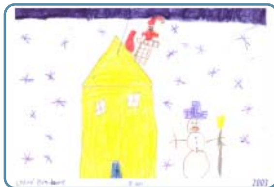
Chloé Brabant - 8 ans