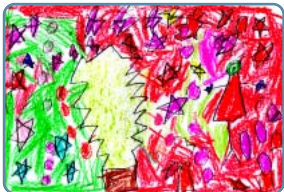
Yasmina Diabaté - 5 ans