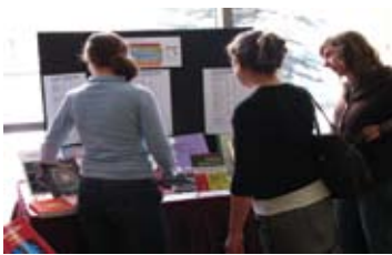
Foire du livre en éducation 6 décembre